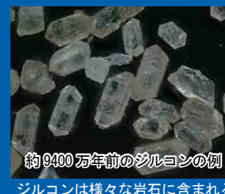
約9400万年前のジルコンの例 ジルコンは様々な岩石に含まれる

地球の歴史は約 46 億年とされています。我々人類が誕生していない太古の歴史をなぜ知ることができるのでしょうか。それは地層や岩石に含まれる鉱物の放射年代測定を行うことで知ることができます。講演では、これまで演者が扱ってきたジルコンと呼ばれる鉱物を用いた年代測定の最新の知見や研究例をもとに日本の地質についてご紹介します。