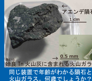
始良 In 火山灰に含まれる火山ガラス 同じ装置で年齢がわかる隕石と火山ガラス。何歳でしょうか？

地球には様々な年齢の石があり、宇宙には地球上の石より古いものもあります。宇宙から降ってくる隕石からわかる天体の年齢も、地球の石やそれを含む地層の年齢も、同じような原理・装置を使って測定します。自分の年齢はわかりますが、隕石が元々いた天体や火山の噴火で生じた火山灰が積もった地層の年齢の測定法とは？